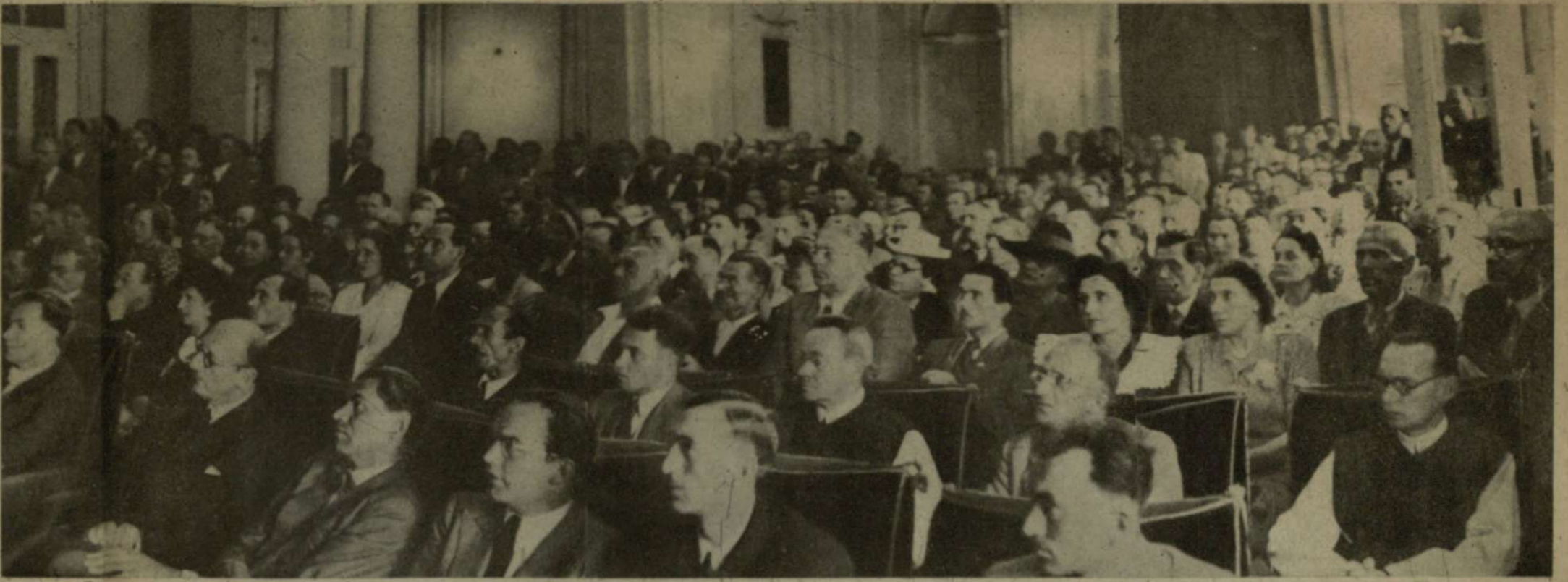
PÉCS VÁROS KÖZÖNSÉGE A NAGYGYŰLÉSÉN