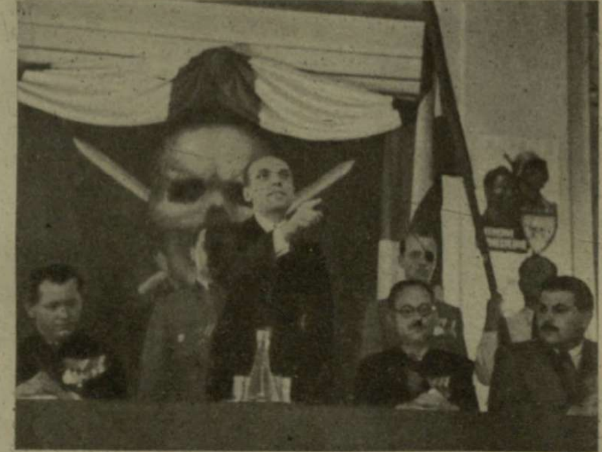
„CÉLTUDATOS, ERŐSKEZŐ, EGYÉSES KORMÁNYZATRA VAN SZÜKSÉG!”