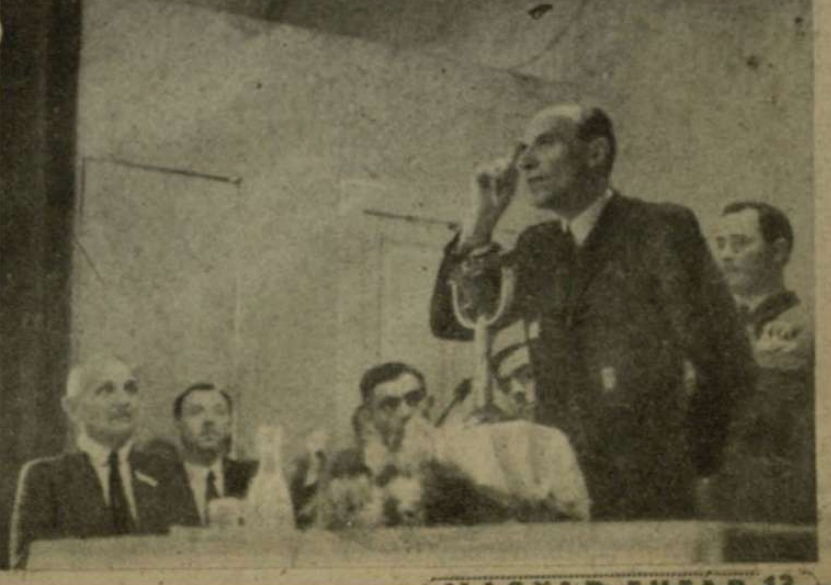
VITÉZ IMRÉDY BÉLA MONDJA A BÁNYÁSZOKNAK: Ha az igazság, emberi életmódot a nemzeti bizalomra akarunk, akkor közelebb kerülhetünk a társadalmi rétegre aligha találhat, mint a bányászokra!