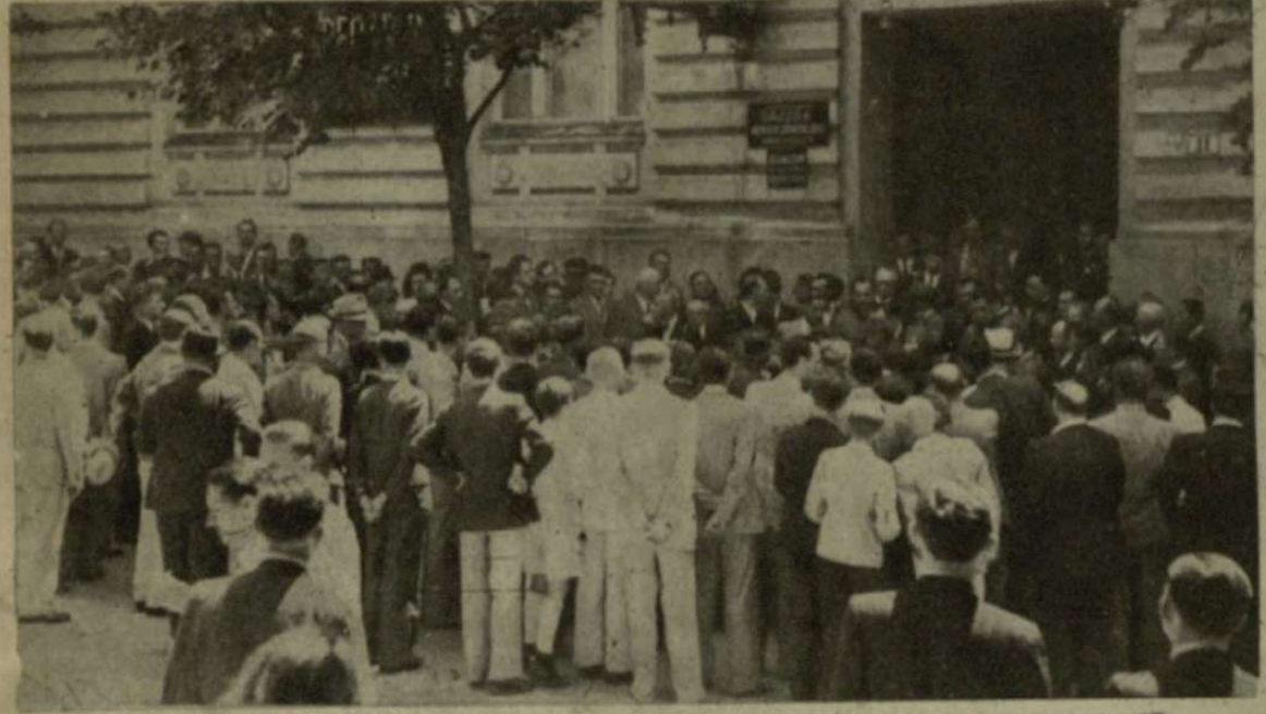
AKIK NEM FÉRTEK BE A GYŰLÉSTEREMBE...

félreérthetetlen határozottsággal szólott hallgatóihoz mindazokról a kérdésekről, melyek sorsdöntőek számunkra. Különösen a bányászok fogadták melegen. Imrédy Bélát, megérezve, hogy a dolgozó milliók sorát őszintén hordozza legfőbb gondjai között. A Magyar Futár mozgalmas képsorozata a pécsi látogatás legkiemelkedőbb jeleneteit örökíti meg.