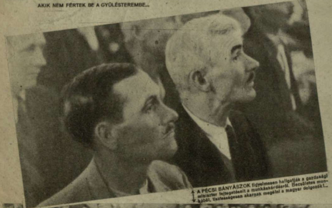
A PÉCSI BÁNYÁSZOK figyelmesen hallgatják a gazdasági miniszter felvilágosítást a munkáskérdésről. Beszélgetés munkákból, tisztoságot akartak megélni a magyar dolgozók!