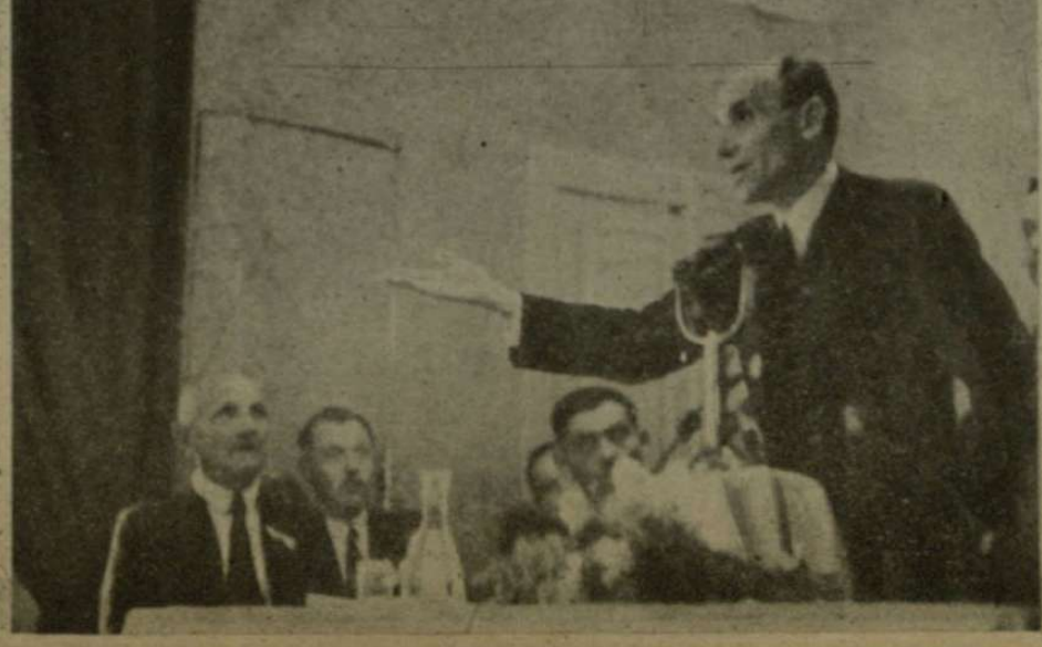
NEM FELTJÚK A MAGYAR ÉLET RENDJÉT A MAGYAR MUNKÁS SZERVEZETTSÉGÉTŐL MEGTEREMTJÜK AZ IPAR ÖSSZES DOLGOZÓINAK HÍVATÁSRENDSZÉT!... Ez a legfontosabb esemény volt vitéz Imrédy Béla pécsi látogatásának