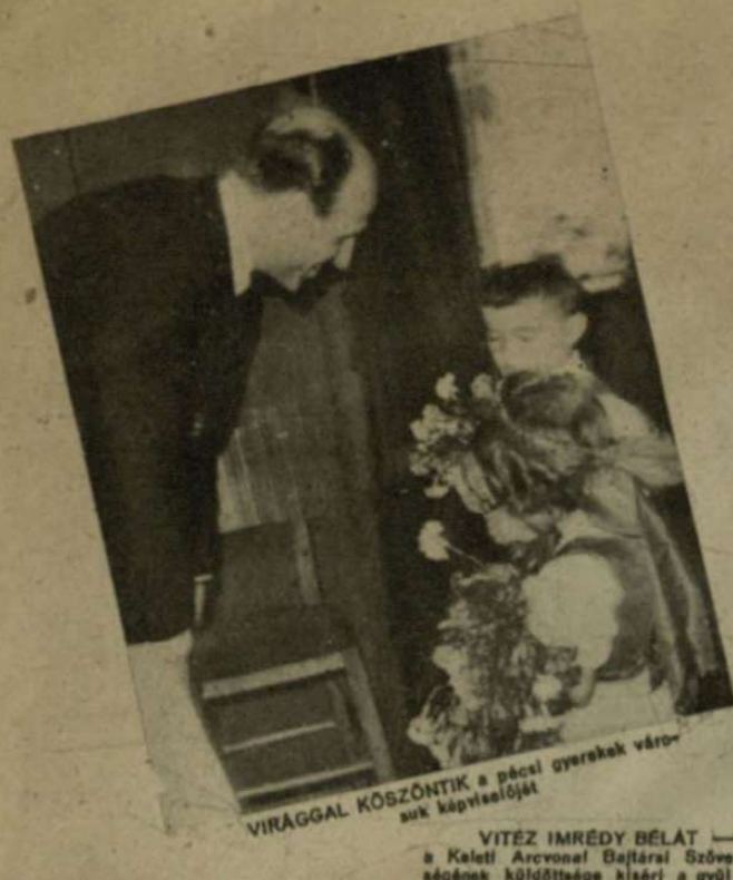
VIRÁGGAL KÖSZÖNTIK a pécsi gyerekek városi képviselőjét VITÉZ IMRÉDY BÉLÁT a Keleti Arconal Dajkáról Szövetéségének küldöttága kíséri a gyűlés színhelyére