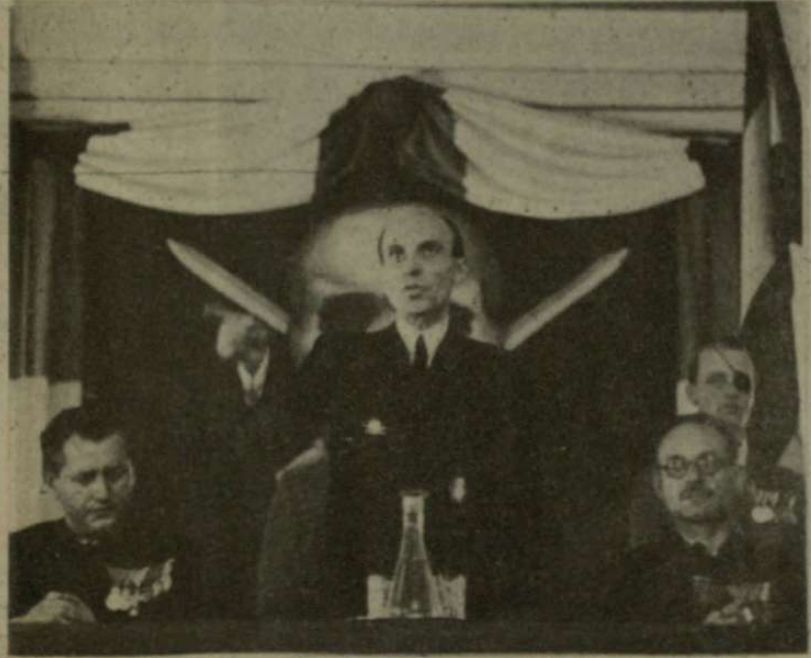
„AZ EURÓPAI SZABADSÁGHARCOT A LEGTELJESEBB EGYETÉRTÉSBEN SZÖVETSEGESEINKKEL *P.L. MEGHARCOLUNK!...”